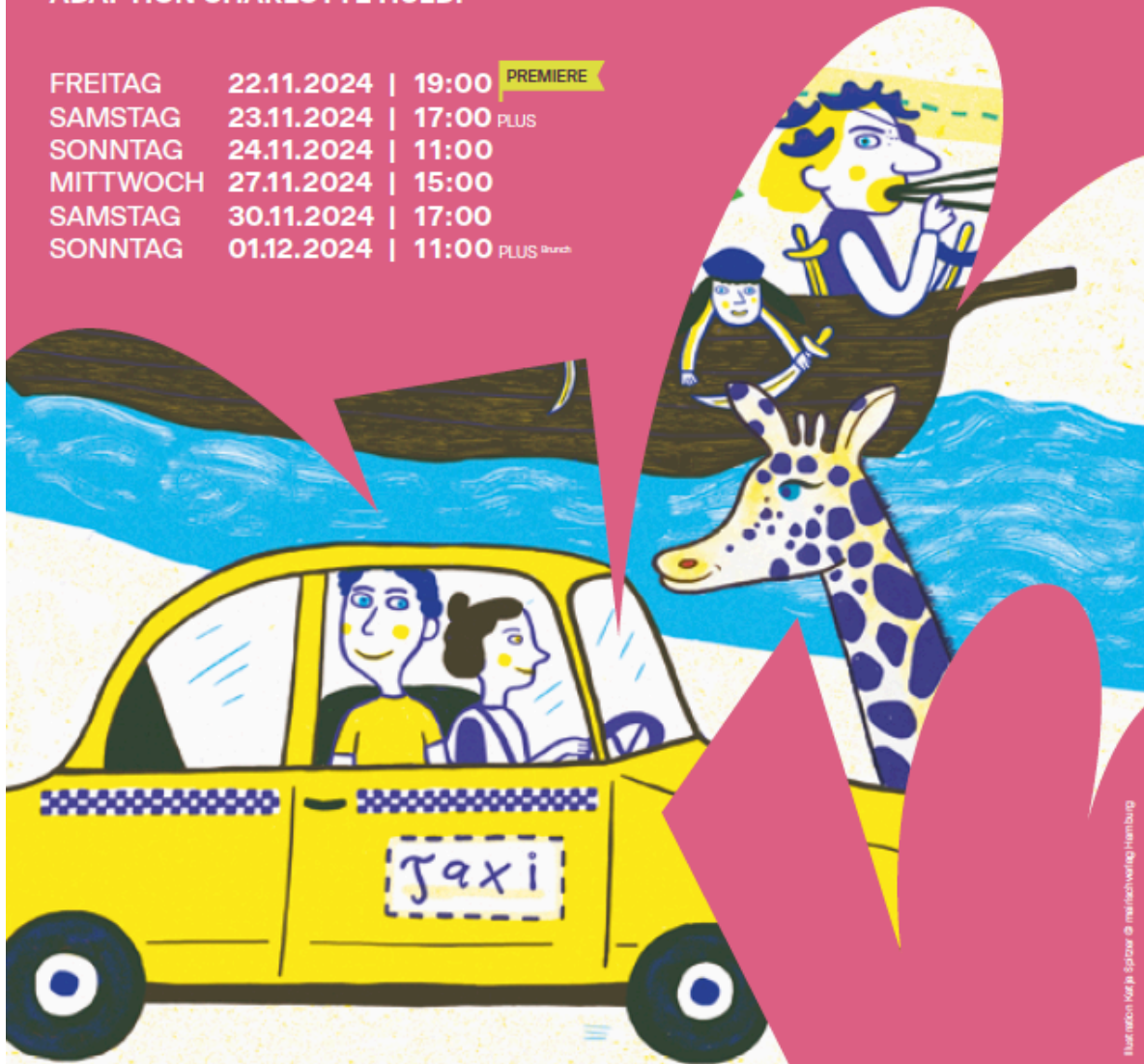
Illustration: Katja Spitzer

FREITAG 22.11.2024 | 19:00 PREMIERE SAMSTAG 23.11.2024 | 17:00 PLUS SONNTAG 24.11.2024 | 11:00 MITTWOCH 27.11.2024 | 15:00 SAMSTAG 30.11.2024 | 17:00 SONNTAG 01.12.2024 | 11:00 PLUS deutsch